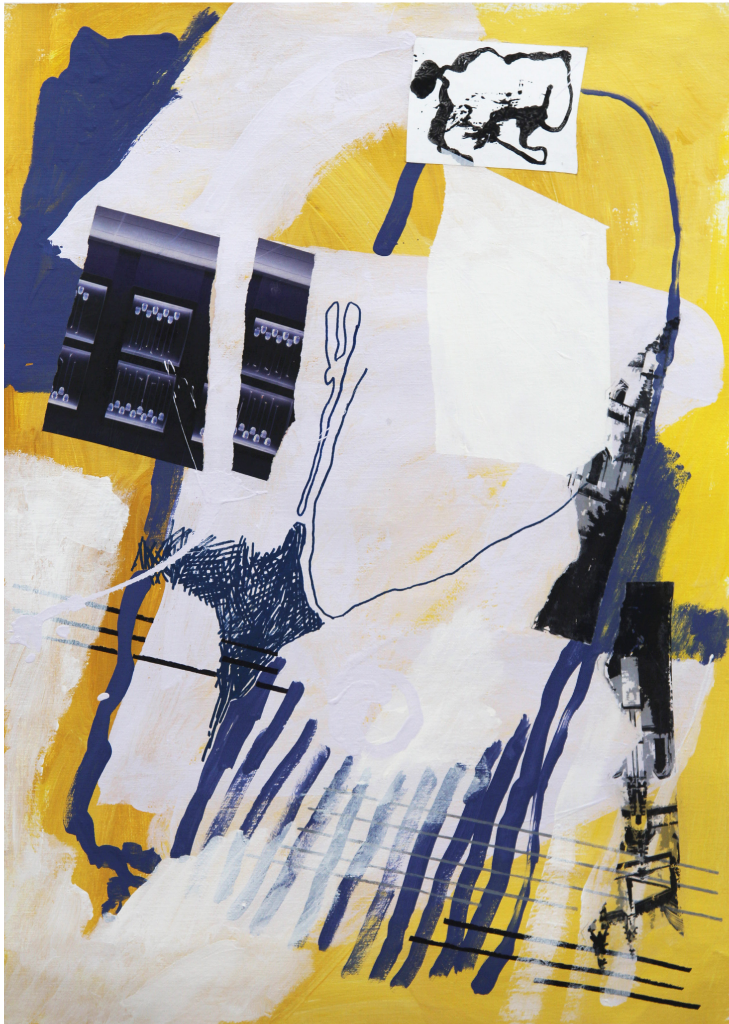
Brez naslova, 2017, mešana tehnika na platnu, 80x60 cm